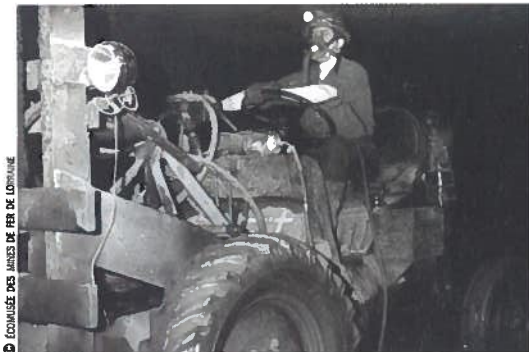
© COGNACISE DES JARDIS DE FER DE LOURNAIE